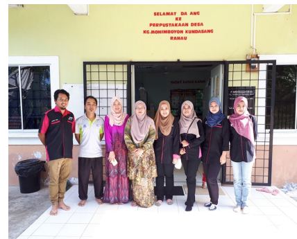
Gambarajah. 1. Gambar-gambar aktiviti di Perpustakaan Desa.